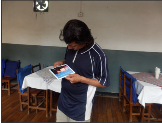
その子の妹は撮れました、可愛すぎる子です