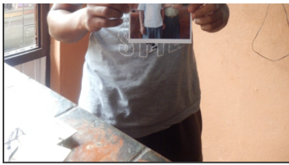
写真に写っている女のコは10歳になりつつんしすぎて写真撮れませんでした！ ただオーナーの弟さん