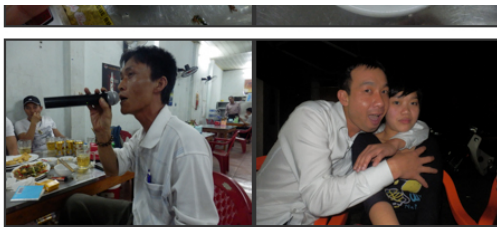
カラオケ好きと、こういうキャラの人は万国共通

知らない土地でこんな出会いができるとは思いませんでした。 英語が通じないのでジェスチャーなどの会話でしたがすごく楽しかったvinh. なにやら手紙とかももらってしまいました。(まったく読めないが)