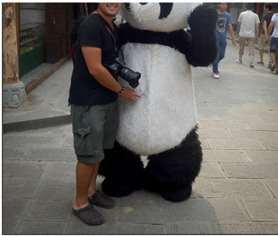
こんなところにも大熊貓が。