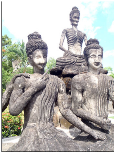
はめ込まれている方と察している方