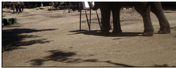
客席にご褒美のサトウキビやチップを要求する奥さん。