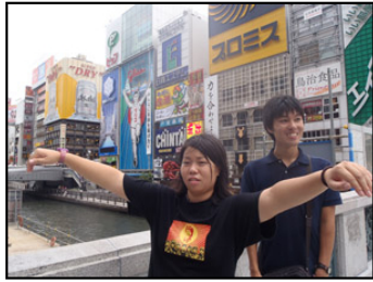
某有名地で記念写真

文字読める！理解できる！あの看板のお店知ってるー！！ 何故がテンション上がります。