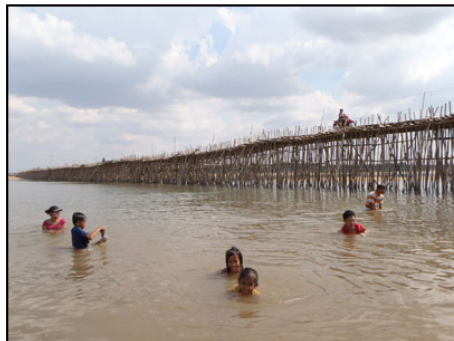
気持ち良さそうですが、私は遠慮しておきました。いろいろ見てるんで。。

また、現在は乾期ということもあってメコンでは水浴びをして遊んでいる地元の人たちも大勢います。