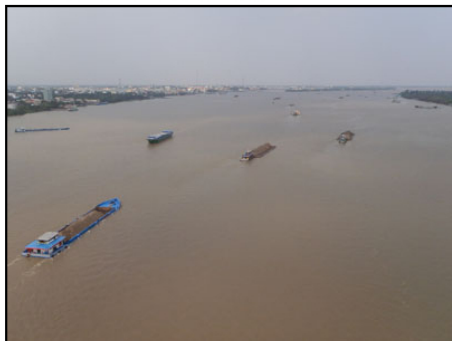
ミトーのメコンさん。私の帽子をよろしく。