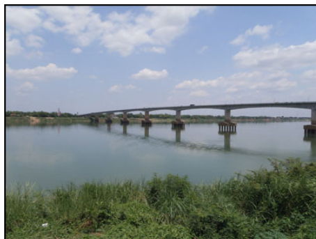
2003年に発行された新500リエル札にも描かれているそうです。

また、現在は乾期ということもあってメコンでは水浴びをして遊んでいる地元の人たちも大勢います。