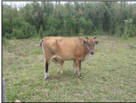
カントーの牛さん。

私のベトナムの撮影地はカントー、ヴィンロン、ミトーの3か所でした。とりあえず、写真を各一枚。