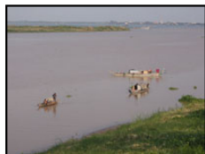
プノンベンで見たメコン川です。