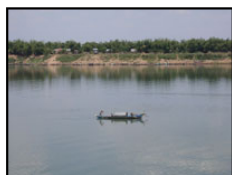
コンボンチャムで見たメコン川。