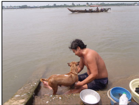
ヴィンロンの犬さんとおじさんとお船さん。