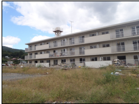
津波のあとの火災で被害に遭った地区。 住んでいる人はほとんどいません。 街灯もないため、夜になると真っ暗になります。