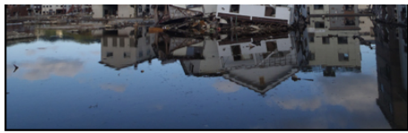
津波の時の海水が未だに引かずに残っています。