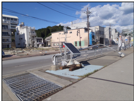
倒れた街灯に電気を送るソーラー電池。