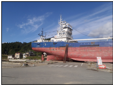
浜で流されて来た船。 津波の強さを物語っています。