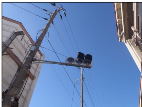
信号も壊れたまま。