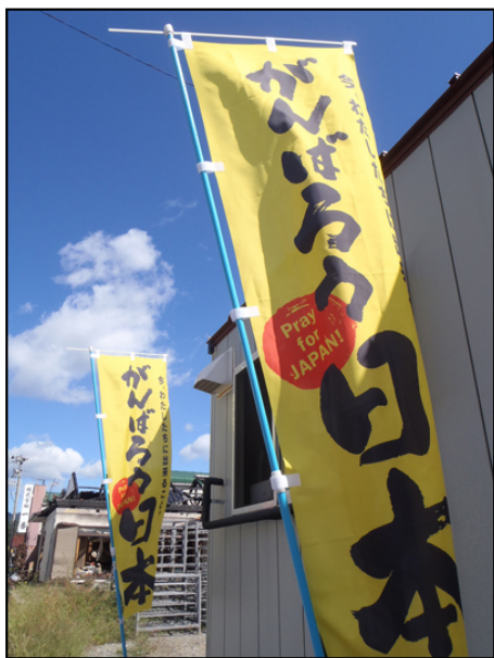
町の至る所に応援するのぼりがたっています。