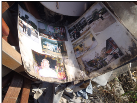
残された家族アルバム。