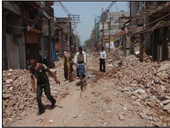
(ホテル前の道。もはや獣道。)