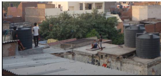
(風揚げ小僧たち。たくさんの風が毎日上がっています。)