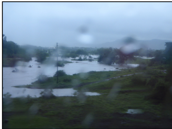
(ムンバイ近く。鉄道からの風景。雨期に入り、大地が水に沈む。)