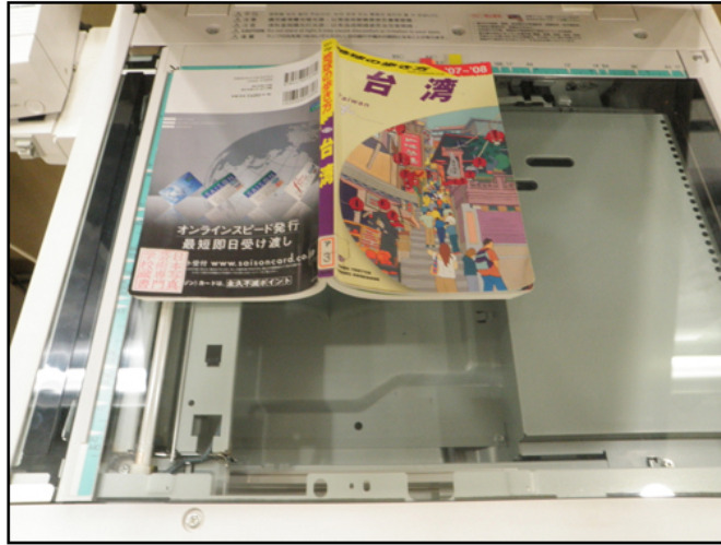
今日は市街地の地図のプリント