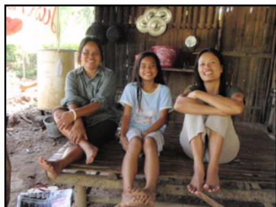
村の人たちは仲が良くて。 のんびりとした村で、撮影をしながら癒されてきました☆