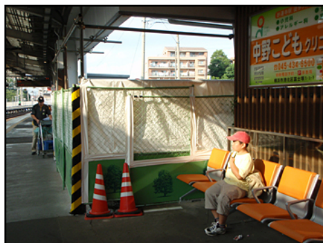
そう、今回はフィールドワークとは関係のない話。