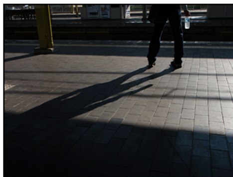
それは帰国してまだ一週間目のこと。