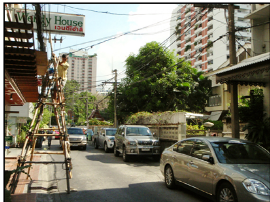
いつもどおりの朝を迎えて。