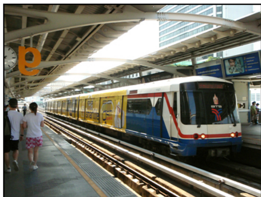
電車に乗って、乗り間違っって。