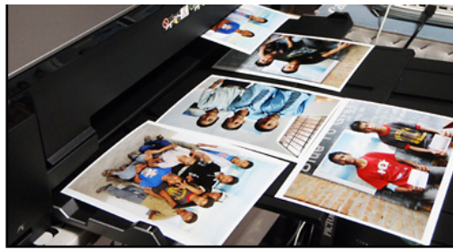
ネパールへ贈る記念写真。