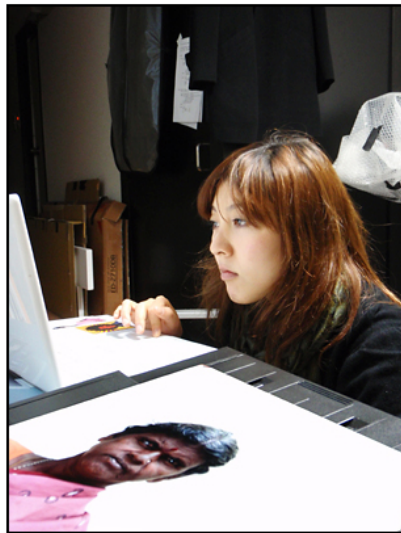
80枚くらいプリントした大佐氏。積まれた空のインク。たまったポイント。