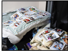
この部屋も大変なことになってきた....。