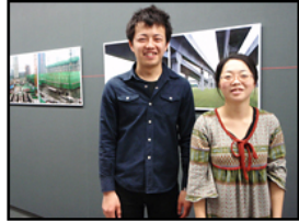
こちらも記念に一枚☆