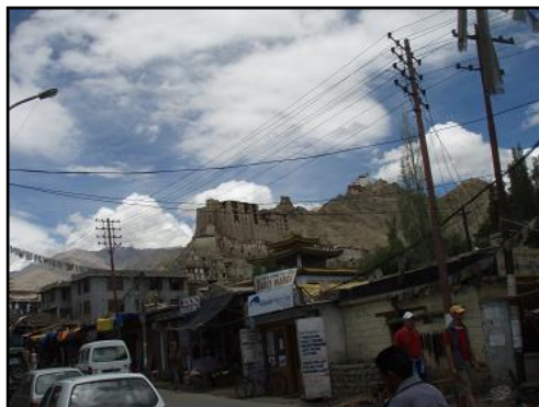
— Leh 市街