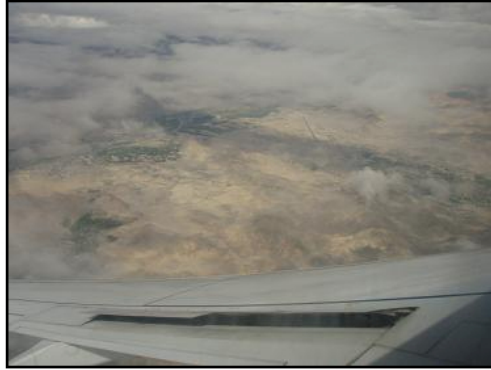
上空から見るラダックは、 幾何学的な—というような 圧倒的に緑の少ない景観とした風景。