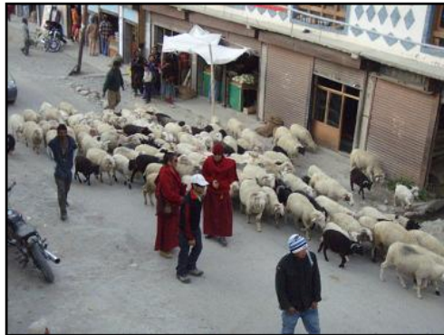
翌7月6日、 郊外の寺院にてダライ・ラマ14世の 誕生記念祭が行われていた。