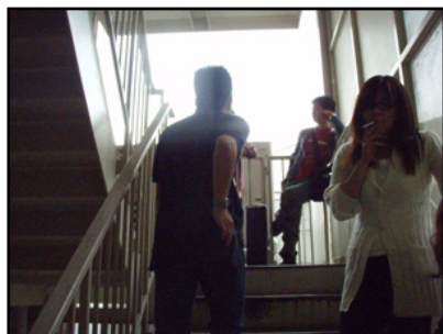
喫煙所兼非常階段