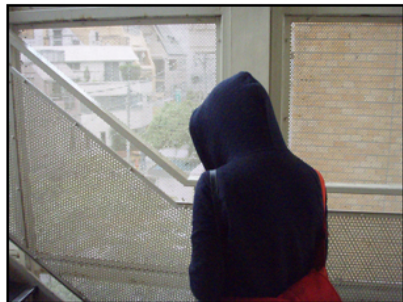
半年ぶりに会った友達

滞国して初の学校訪問。 懐かしいっす。隣にコンビニができていたっす。 非常階段は相変わらず。 半年ぶりにあった友達は明るくなってたし。 久しぶりっていいね。