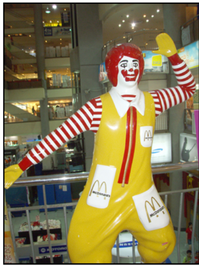
ベナンのドナルド。なんか変じゃない？