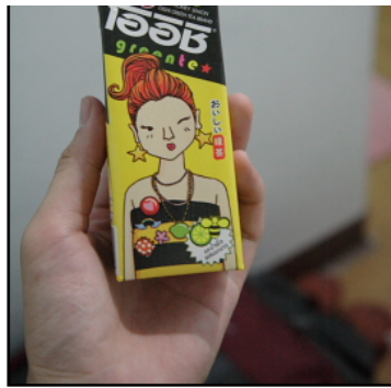
レモンティーっばい