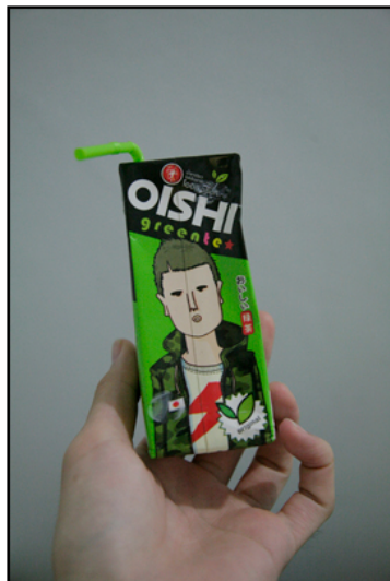
ストレートティーっばい

商品名、おいしい緑茶。 いや、本当においしいです。甘い緑茶です。 紅茶に似た味って言えばわかりやすいかな？ わからない人は実際に緑茶に砂糖を入れて試してみてください。