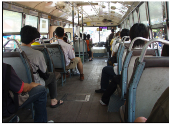
バスはとにかくワカリスライ。