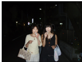
じーちゃんばーちゃんにお土産お好み。