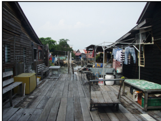
海のうえにお家があって、