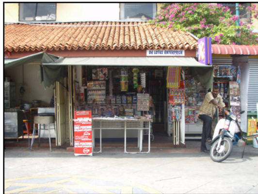
とてもエキサイティングな お国です