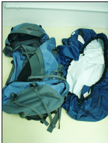
抜けガラ バックバックと、バックカバー ベターーン。

っとなって、 そんなとき、 FW一期生ナナコ先輩のブログ、 とても参考になりました 神かとおもいました さー、 神2号です。 さー、 よくみとけオラ!!!