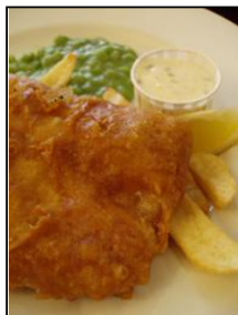
手のひらサイズフィッシュ。