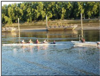
北京オリンピック。室内自転車とこちらとセーリングをよく映してました。 お国柄ですね。自転車なんて今までちゃんと見たことなかった。