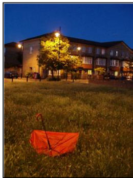
前の建物が前お世話になっていた家の群です。大きい長屋?みたいな。

それにしても。ルー語は、英語の初期段階の症状だったんですね。 知らなかったなあ。。