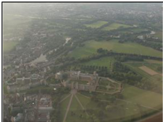
来た時お空からの景色。

早い。 月日が経つのは本当に早いです。困る。 こちらにも慣れてきた気がします。 やっとなんとかできたので、写真を少々UPします。