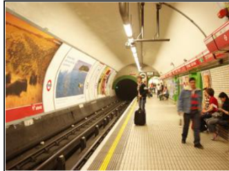
学校の最寄り駅。ど真ん中です。お土産やさんもいっぱい。