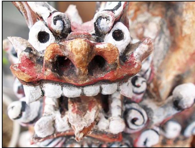
写真2 (オリンパス・E-1使用) シーサー (守り神)