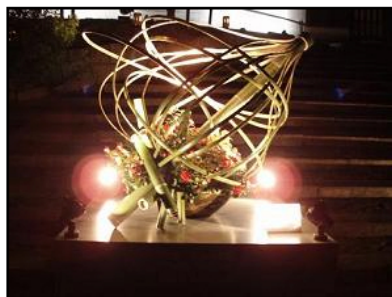
花灯路にあったオブジェ。幻想的な雰囲気印象的だった。