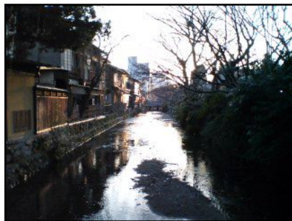
祇園にあった、とある川を眺めて。

それはとても嬉しい。 京都で知り合った人もいる。 錦市場のあるお煎餅屋さんのおばさんとか、大将と呼ばれていた魚屋さんのおじさん、清水寺で改修作業をしていた作業員の皆様、北山ユースホステルのご主人。。。 数えたら切りがない。 今回もそんな出会いがあった。 昨夜の寝不足と慣れない大荷物で疲れていたのに、宿に着いてから街に行こうか行くまいか悩んだ挙げ句、東山ではなく祇園の方に足を伸ばしてしまった。 錦市場を懐かしいと思いつつ抜け、祇園に着いてみると、いつもはあまり通らないような小道で綺麗な風景を見つけた。その風景になんとなくカメラを向けて撮っていたら(下の写真です)、声をかけられた。 「どこらへんを撮ってはるんですか？」 関西弁の独特なイントネーション。それから話をしてみると、彼女は水彩画を描いていて、その元になる写真を撮りたいと思っていたが、うまく撮れなくて困っているということがわかった。それから色々話をしているうちに打ち解けて、なかなか面白い話が聞けた。 抹茶と和菓子まで御馳走になってしまいました。ありがとうございました。 その後、東山の花灯路を案内して頂いた。 神戸に住んでいる彼女はなかなか京都にも詳しく、いろんなお店や、脇道にある、敷居の高い料亭の名前を教えてくれたりもした。 思いがけず、京都のイベントを楽しめた夕刻過ぎ。 また一つ思い出が増えました。