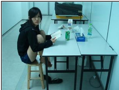
とりあえず記念に。