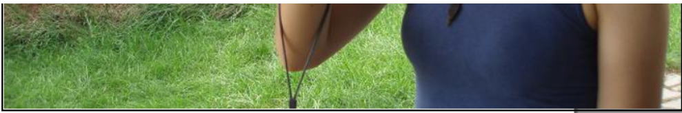
北京撮影疲れ。北京の公園でかすぎで苛立つ。