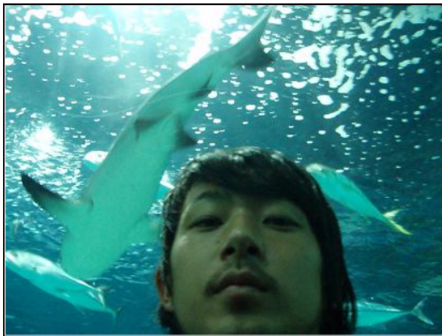
青島撮影はりぎり。後はジャスコに通う。