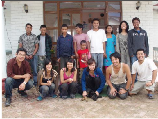
いやいや、なつかしい。 写真展は すごく大変で忙しかったけど 充実している 日々のが絶対いいな。

カテゴリ： post by 徳田 敬太 | 日時: 2007.10.23 | バナーリンク | コメント(4)