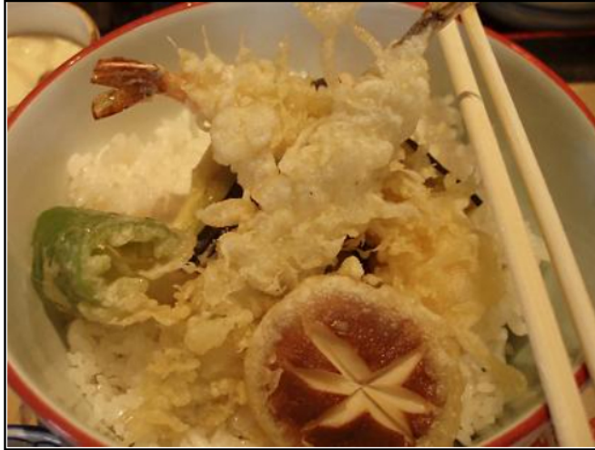
太陽の日差しと蒸し暑さに参る成都でした。