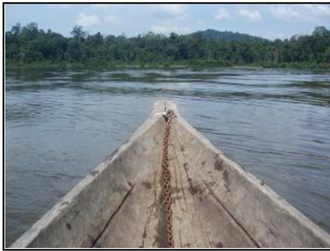
カヌーでチニレイクへ