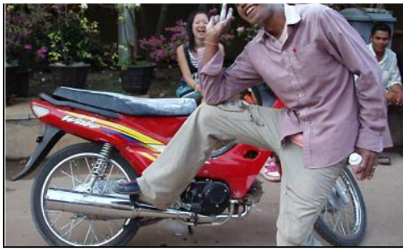
IDを拾って活動中のエセNGOウェーハー。