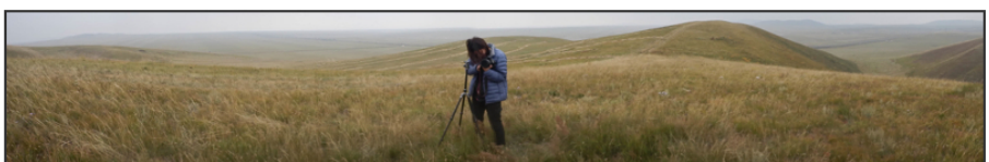
まるでカメラマンのようだ。